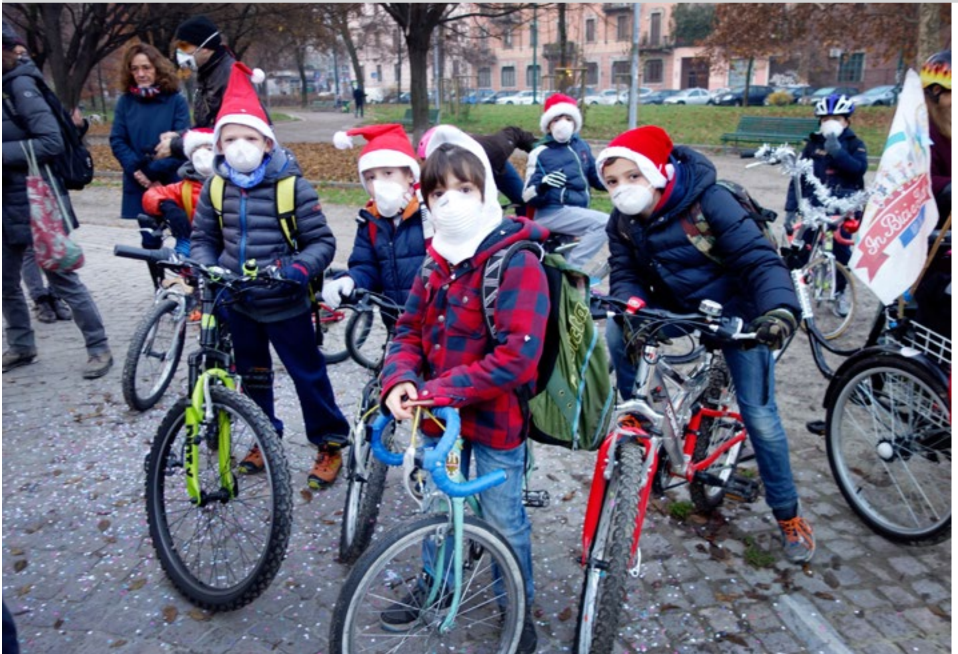
Det är snart skolavslutning och eleverna är denna morgon iförda tomteluvor och munskydd. De kastar konfetti och ska få förbipasserande att stanna upp och tänka efter.